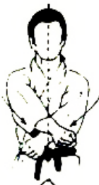
GEDAN JUJI UKE