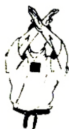
JODAN JUJI UKE