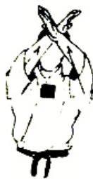
JODAN JUJI UKE